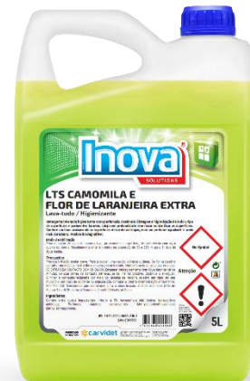
IMAGEM DE PRODUTO